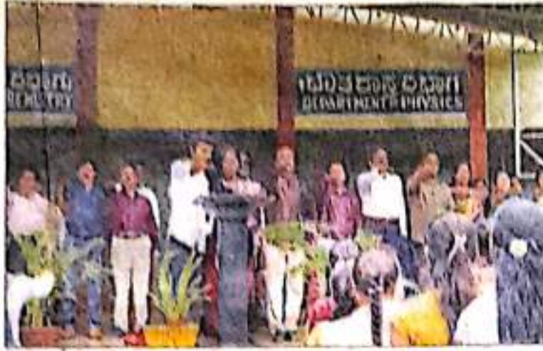
ಶಿವಮೊಗ್ಗದ ಕಲ್ಯಾಣ ವಿಜ್ಞಾನ ಕಾಲೇಜಿನಲ್ಲಿ ನಡೆದ ಸದ್ಭಾವನಾ ದಿನಾಚರಣೆಯಲ್ಲಿ ವತಿಜ್ಞಾ ವಿಧಿ ಬೋಧಿಸಲಾಯಿತು