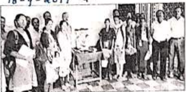
ತಿಪಟೂರಿನ ಕೆಲವು ಪ್ರಭುತ್ವ ದರ್ಶನ ವಿಜ್ಞಾನ ಕಾಲೇಜಿನಲ್ಲಿ ಆಚರಿಸಿದ ಡಾ. ಬಿ.ಆರ್. ಅಂಬೇಡ್ಕರ್ ಜಯಂತಿಯಲ್ಲಿ ಆಧ್ಯಾಪಕರು ಹಾಗೂ ವಿದ್ಯಾರ್ಥಿಗಳು.