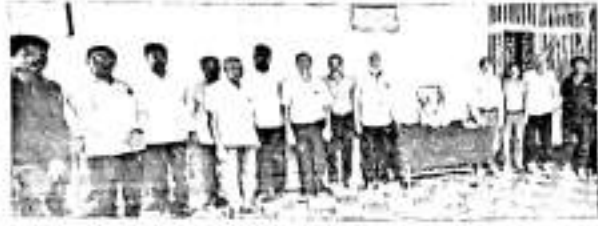
ಕನಕದಾಸರ ಜಯಂತಿಯಲ್ಲಿ ಭಾಗವಹಿಸಿದ್ದ ಅಧ್ಯಾಪಕ, ಅಧ್ಯಾಪಕೇತರ ಸಿಬ್ಬಂದಿಗಳು.