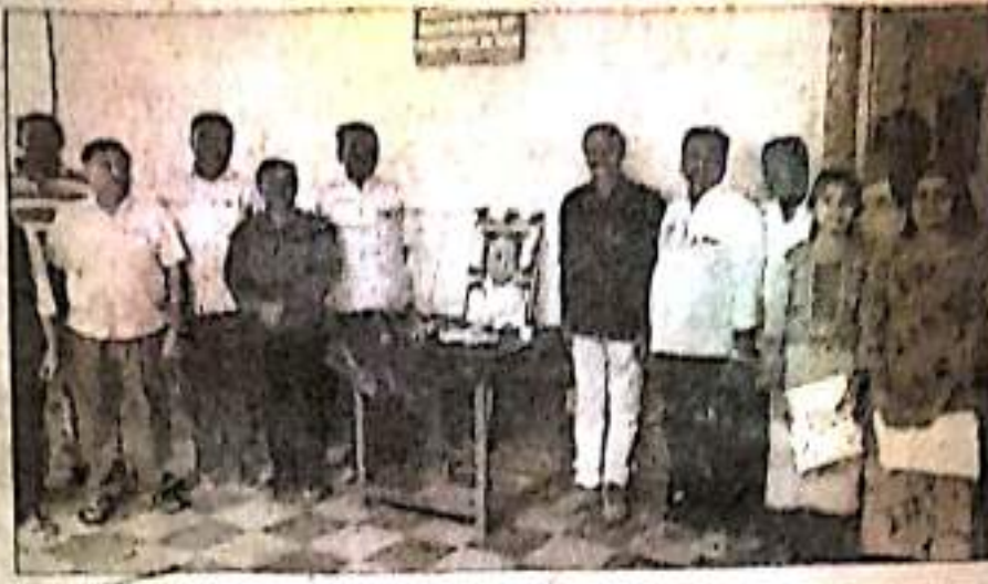
ತಿಪಟೂರಿನ ಕಲತರು ಪ್ರಥಮ ದರ್ಜೆ ವಿಜ್ಞಾನ ಕಾಲೇಜಿನಲ್ಲಿ ಉಕ್ಕಿನ ಮನುಷ್ಯ, ಅಪ್ರತಿಮ ದೇಶಭಕ್ತ ಸರ್ದಾರ್ ವಲ್ಲಭಾ ಭಾಯಿ ಪಟೇಲ್ ರವರ ಜನ್ಮ ದಿನದ ಅಂಗವಾಗಿ ರಾಷ್ಟ್ರೀಯ ಏಕತಾ ದಿನವನ್ನು ಆಚರಿಸಲಾಯಿತು.