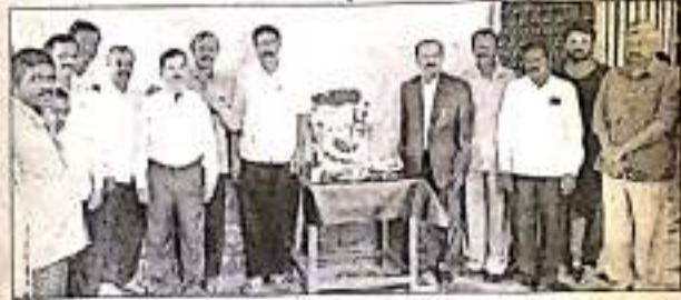
ಕಲ್ಪತರು ಪ್ರಥಮ ದರ್ಜೆ ವಿಜ್ಞಾನ ಕಾಲೇಜಿನಲ್ಲಿ 61ನೇ ಕನ್ನಡ ರಾಜ್ಯೋತ್ಸವವನ್ನು ಆಚರಿಸಲಾಯಿತು.