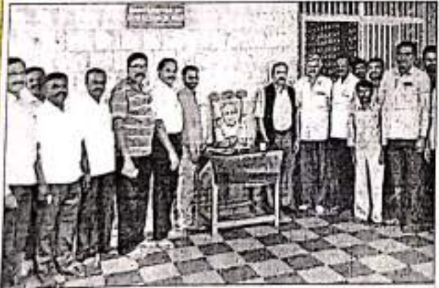
Staff of Kalpataru First Grade Science College during an event to mark Sardar Vallabhbhai Patel Jayanti in the college in Tiptur, recently.