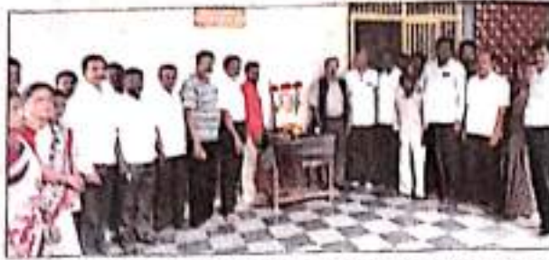
ತಿಪಟೂರಿನ ಕಲ್ಪತರು ಪ್ರಭು ಮಹಿಮೆ ವಿಜ್ಞಾನ ಕಾಲೇಜಿನಲ್ಲಿ ಸರ್ದಾರ್ ವಲ್ಲಭಭಾಯಿ ಪಟೇಲ್ ಅವರ ಜನ್ಮದಿನಾಚರಣೆಯನ್ನು ಆಚರಿಸಲಾಯಿತು.

ಕಲ್ಪತರು ಪ್ರಭು ಮಹಿಮೆ ವಿಜ್ಞಾನ ಕಾಲೇಜಿನಲ್ಲಿ ವಿಜ್ಞಾನ ದಿವ್ಯ ಸರ್ದಾರ್ ವಲ್ಲಭಭಾಯಿ ಪಟೇಲ್ ಅವರ ಜನ್ಮದಿನಾಚರಣೆಯಲ್ಲಿ ಭಾಗವಹಿಸಿ, ಸರ್ದಾರ್ ವಲ್ಲಭಭಾಯಿ ಪಟೇಲ್ ಸ್ಮರಣೆ