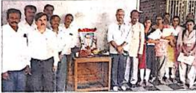
ತಿಪಟೂರಿನಲ್ಲಿ ನಡೆದ ಡಾ. ಬಿ.ಆರ್. ಅಂಬೇಡ್ಕರ್ ಜಯಂತಿಯಲ್ಲಿ ಅಧ್ಯಾಪಕ ಮತ್ತು ಅಧ್ಯಾಪಕೇತರರು ಇದ್ದರು.