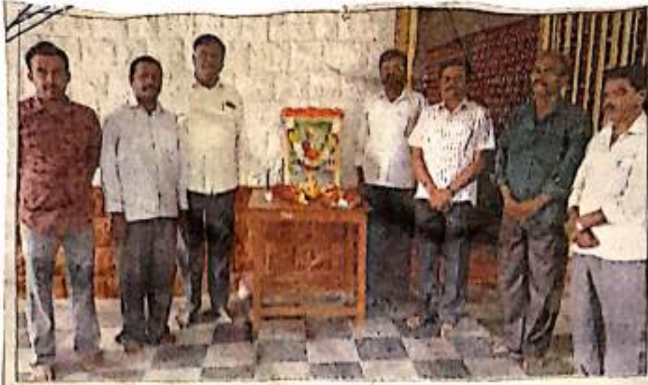
ತಿಪಟೂರಿನ ಕಲ್ಪತರು ಪ್ರಥಮ ದರ್ಜೆ ವಿಜ್ಞಾನ ಕಾಲೇಜಿನಲ್ಲಿ ನಡೆದ ಕನಕದಾಸರ ಜಯಂತಿಯಲ್ಲಿ ಬೋಧಕ ಮತ್ತು ಬೋಧಕೇತರ ವರ್ಗದವರಿದ್ದರು.